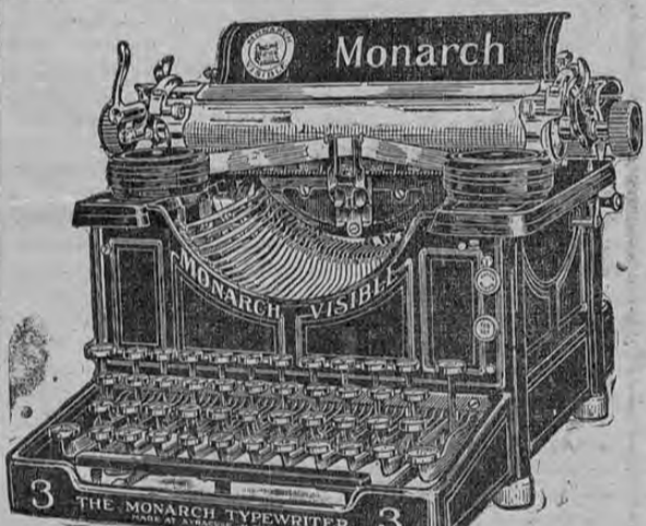
Unicos Agentes en Costa Rica - TREJOS HERMANOS 2883-8 fb.

Especialista en las enfermedades del vientre ex-asistente por varios años de la Clínica Quirúrgica del Hospital de Hamburgo-Eppendorf, ha regresado de su viaje de estudio en Europa y tiene el honor de ofrecer de nuevo sus servicios al público, en su antigua oficina, 50 varas al Sur de la Botica Francesa. 3420-18 ab.